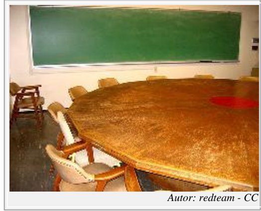
Autor: redteam - CC