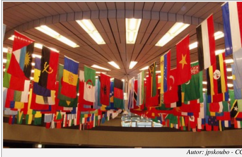
Autor: jpskoubo - CC